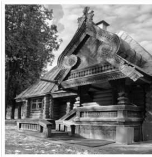
Мастерская «Детское воспитание»